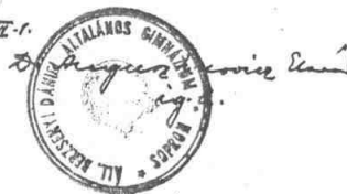
2. kép. 11